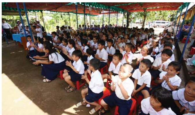
佳能越南为在校师生带去爱与希望