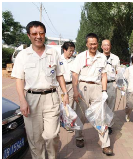
佳能环境清洁活动