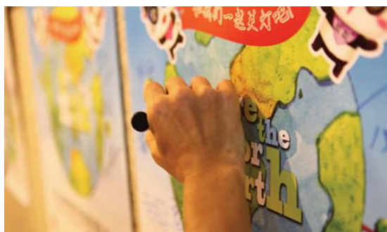
佳能环保月，绿色进行时

探寻绿色数码产品“生长”轨迹 Discover the "life track" of eco digital product