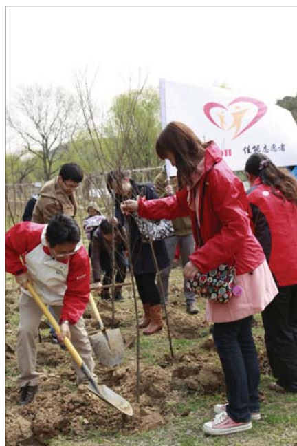
佳能（中国）南京分公司植树行动