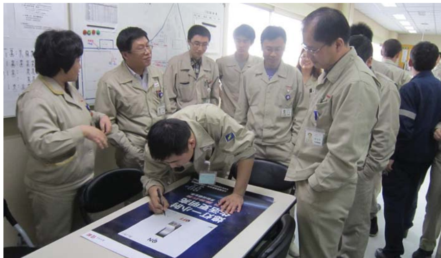
佳能员工参与“地球一小时活动”