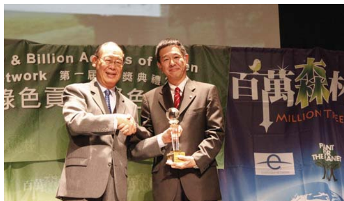
佳能荣获“世界地球日”组织颁发的“绿色永续奖”

此外，佳能越南还为两校师生免费拍照并打印照片。通过此次活动，佳能越南希望可以激励教师在完成教育使命的过程中保持乐观精神，克服种种障碍，将知识与爱传播给每一位学生。