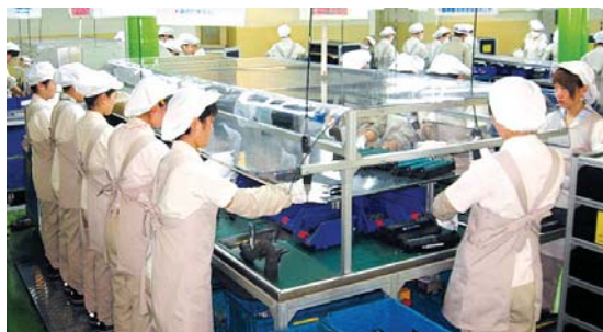
社科院专家参观佳能大连生产基地

佳能“影像公益地图”，传播正能量 "Philanthropy footprint in China", Spreads Positive Energy