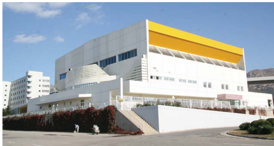
佳能大连生产基地员工体育馆一景

大连生产基地很早便提出国际化人才育成计划。目前基地拥有各类讲师180多人，并与佳能集团总部随时进行新课程的沟通与导入。大连生产基地每年都举办日语演讲比赛，至今已经连续办了8届，同时也在内部办日语学习班，有兴趣的员工可以免费学习。大连生产基地贯彻佳能集团总部的“名匠制度”，通过该制度培训了一级技术高手17人，二级技术人员258人。外部技术研修对技术人员来说非常有吸引力，也有机会被选派去日本学习。2012年，大连生产基地成为了佳能集团内部培训人数最多的公司。