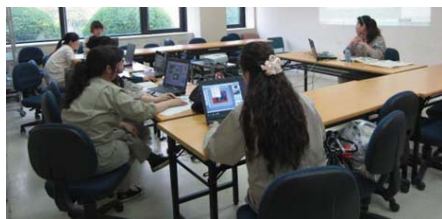
身障员工也有机会成为老师，为大家授课

Canon's production base in Dalian has nearly 6,000 employees with the average age of 26. Under the background of serious turnover of the generation after 1990s in the electronic industry, staff turnover of Dalian Production Base in 2012 was only 3% which is much lower than the average level. Why is Canon Dalian Production Base able to retain its employees? The answer is that, all employees here live in a very safety, healthy and stable environment. Equipped with central air conditioning, the dormitory can house 5,000 staff in the company resident area. Three meals provided by the company with almost free of charge, just 46 Yuan cost per month. Besides,