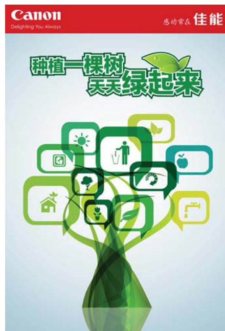
"种植一棵树，天天绿起来" 宣传海报