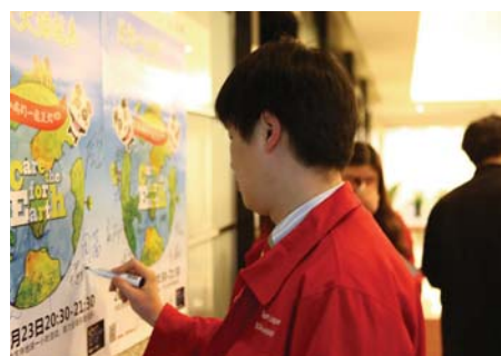
佳能号召内部员工与经销商共同参与关灯一小时活动