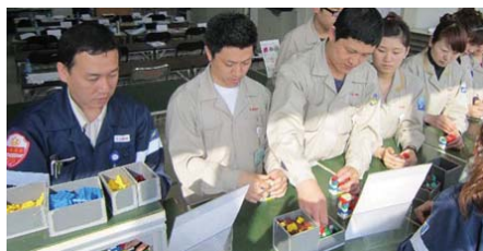
员工正在接受专业技能训练

大连生产基地的员工来自祖国各地，住是一个大问题。大连生产基地为员工提供可容纳5000人的宿舍，还有物美价廉的一日三餐，一个月的生活成本比较低。从2012年开始，大连生产基地还为员工宿舍换装了带有冷暖功能